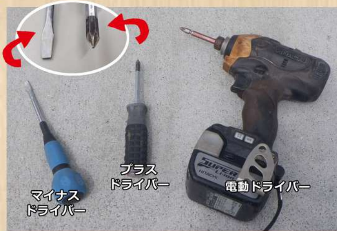
マイナスドライバー