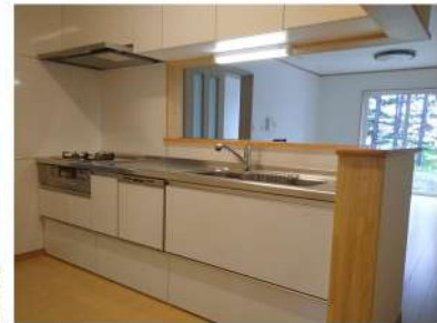
▲広々リビングに 食洗器つきの対面キッチン♪

太陽光発電やシャワールームも 備わっています。 完成したばかりの 室内をちょこっと拝見!