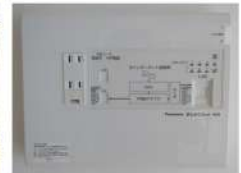
◀ 宅内LAN パネルで まとめて ネット♪