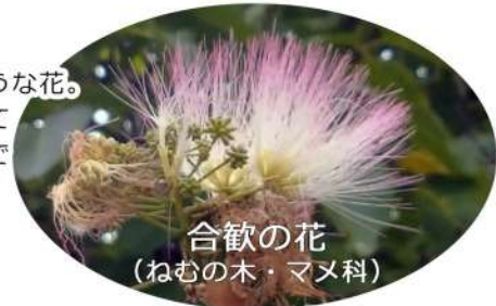
合歓の花 (ねむの木・マメ科)

淡い色のまつ毛のような花。夜になると葉を閉じて眠ったようになるのでこの名があります。花の後にはサヤ状の実がなるんですね。