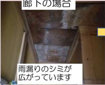
雨漏りのシミが 広がっています