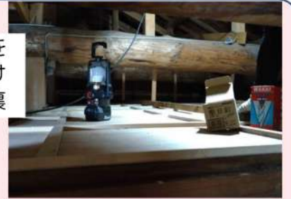
天井板を 貼りつけ た天井裏