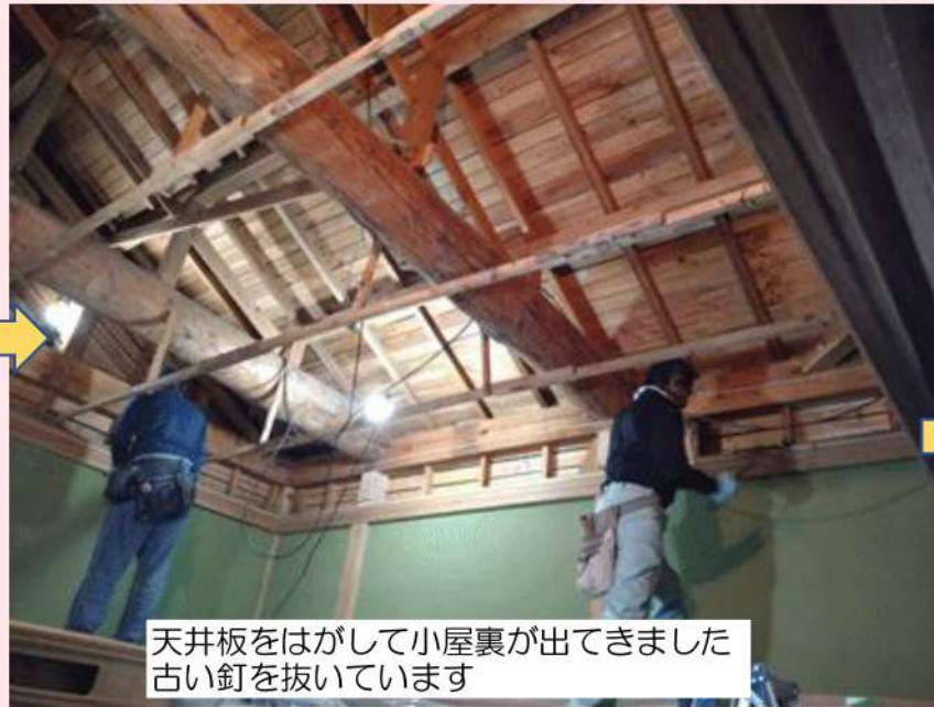
天井板をはがして小屋裏が出てきました 古い釘を抜いています