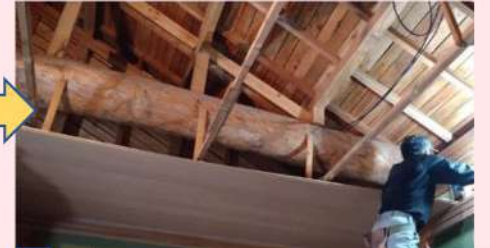
天井板を貼りつけています