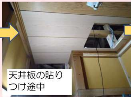
天井板の貼り つけ途中