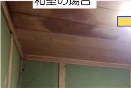
雨漏りのシミが 広がっています