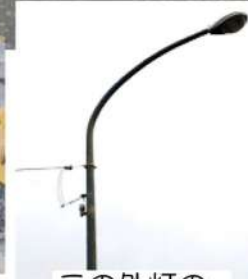
この外灯の 下です