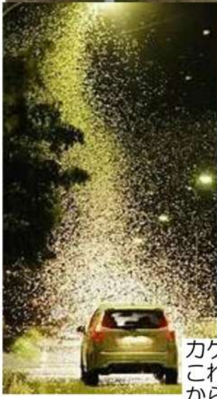
カゲロウの乱舞