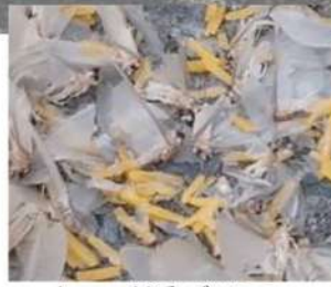
よ〜く近づいて 見ると